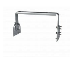
Кронштейн Лира Unit 60 (комплект)